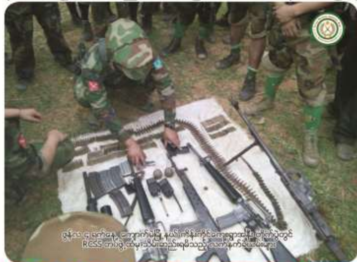
ဇူလိုင်လ ၄ ရက်နေ့ ကျောက်မဲမြို့နယ်၊ ကိန်းကိုင်ကျေးရွာအနီးတိုက်ပွဲတွင် RCSS တပ်ဖွဲ့ထိန်းသိမ်းဆည်းရမိသည့် လက်နက်ငယ်အမျိုးအစားများ

တအာင်းဒေသ၊ တပ်မဟာ (၂) နယ်မြေ၊ ကျောက်မဲမြို့နယ်၊ မိုင်းငေါမြို့နယ်ခွဲ၊ ကိန်းကိုင်ကျေးရွာ အနီးရှိ RCSS/SSA ကျူးကျော်စခန်း၌ ယနေ့ ဇူလိုင်လ ၄ ရက် နံနက် ၀၉:၃၀ မှ ၁၃:၃၀ နာရီအချိန်ထိ တအာင်းအမျိုးသား လွတ်မြောက်ရေး တပ်မတော် (TNLA) တပ်ရင်း (၉၈၇) နှင့် RCSS/SSAတပ်ဖွဲ့တို့ အပြင်းအထန်တိုက်ပွဲ ဖြစ်ပွားခဲ့ပြီး အဆိုပါစခန်းအား တအာင်းတပ်မတော်မှ တက်ရောက် ရှင်းလင်းနိုင်ခဲ့သည်။ အဆိုပါ စခန်းအားတက်ရောက်ရှင်းလင်းစဉ် RCSS/SSAတပ်ဖွဲ့အလောင်း (၉) လောင်း၊ လက်နက်ငယ်အမျိုးအစား M-16-၄ လက်၊ စက်လတ် (ငါးကြင်းခြီး) ၁ လက်၊ ပစ္စတို ၂ လက်၊ လက်ကိုင်စကားပြောစက် (ICON) ၂ လုံး သိမ်းဆည်းရမိသည်။ တအာင်းတပ်မတော်ဖက်မှ ၂ ဦး အမျိုးသားအတွက် အသက် ပေးလှူ သွားခဲ့သည်။ RCSS/SSAတပ်ဖွဲ့သည် အဆိုပါစခရာ၌ ကျူးကျော်စခန်းချကာ လမ်းသွားလမ်းလာ မိဘပြည်သူများ ဖမ်းဆီးစစ်ဆေးခြင်း၊ မိုင်းထောင်ခြင်း၊ ဆက်ကြေးကောက်ခံခြင်း၊ တပ်သားသစ်စုဆောင်းခြင်းပြုလုပ်သည့် နေရာဖြစ်သည်။