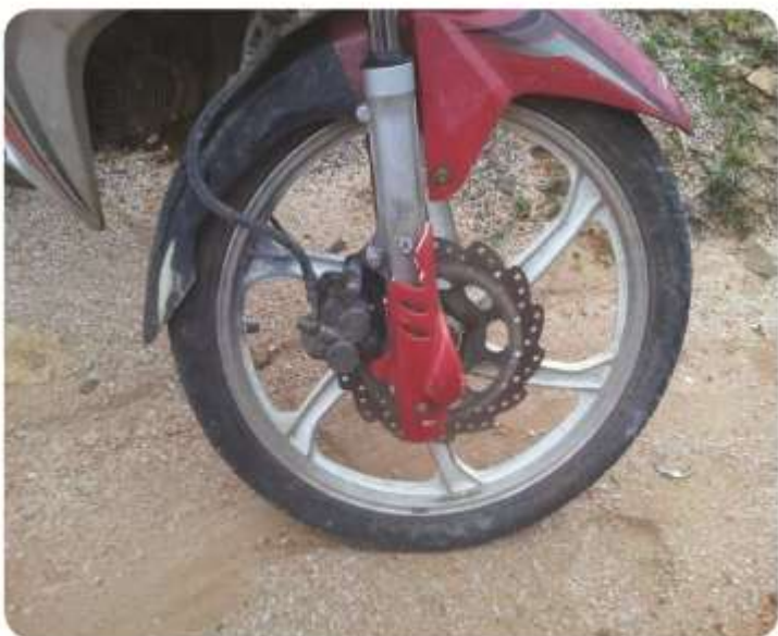
မြန်မာ့တပ်မတော်စကခ-၁ ကျောက်မဲလက်အောက်ခံတပ်မှ၏သေနတ်များဖြင့်ပစ်ခတ်ခြင်းခံလိုက်ရသောဒေသပွဲခြားရေးစီမံကိန်းဝန်ထမ်းများ၏ဆိုင်ကယ်များ