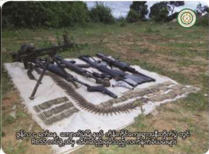
ဇူလိုင်လ ၄ ရက်နေ့ ကျောက်မဲမြို့နယ်၊ ကိန်းကိုင်ကျေးရွာအနီးတိုက်ပွဲ တွင် RCSS တပ်ဖွဲ့ထိန်းသိမ်းဆည်းရမိသည့် လက်နက်ငယ်အမျိုးအစားများ